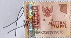
Nita Happy Hapsari