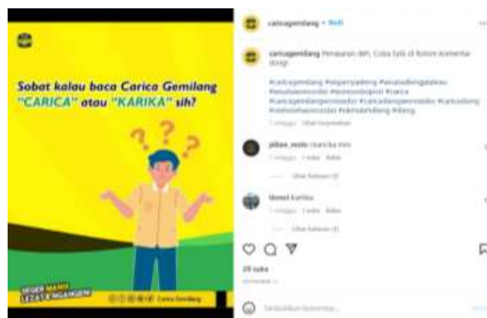
Gambar 1. 3 konten ajakan interaksi di akun Instagram @caricagemilang