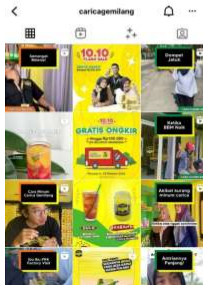
Gambar 1. 8 Feeds Instagram @caricagemilang