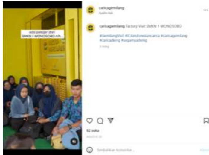
Gambar 1. 5 konten factory visit di akun Instagram @caricagemilang