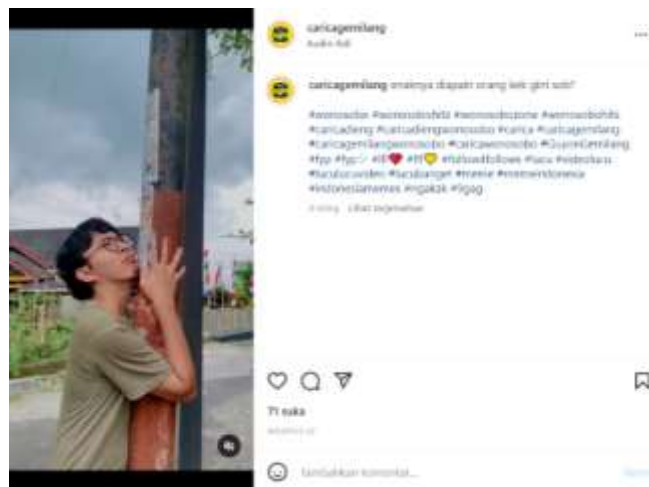
Gambar 1. 6 konten hiburan di akun Instagram @caricagemilang