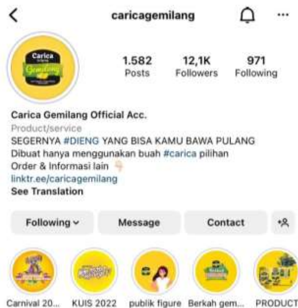
Gambar 1. 2 akun Instagram @caricagemilang

Minuman carica menjadi salah satu makanan khas yang menjadi oleh-oleh jika berkunjung ke Wonosobo. Industri olahan carica merupakan bagian dari industri olahan makanan dan minuman. Industri olahan carica ini diproduksi dalam skala industri rumahan. Salah satu produsen carica yang sudah besar dan memiliki banyak reseller adalah Carica Gemilang. Carica Gemilang memiliki akun Instagram @caricagemilang dengan jumlah pengikut yang cukup tinggi dibanding kompetitor lainnya. Selain memiliki jumlah pengikut yang banyak, akun Instagram carica gemilang ini juga memiliki intensitas dan kreativitas yang tinggi.