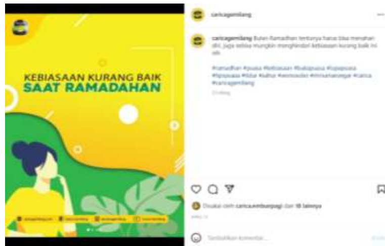
Gambar 1. 7 konten edukasi di akun Instagram @caricagemilang