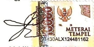
Nabiilah Taqiyyah Rizoan