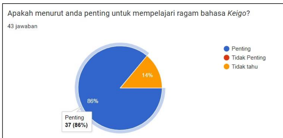
Gambar 3 Apakah mempelajari keigo itu penting?

Meskipun begitu, mahasiswa menganggap mempelajari keigo merupakan salah satu aspek yang penting dalam pembelajaran bahasa Jepang. Hasil survey yang dilakukan oleh peneliti menunjukkan terdapat 86% atau 37 orang mahasiswa yang menjawab bahwa mempelajari keigo itu penting, dan sisanya menjawab tidak tahu.