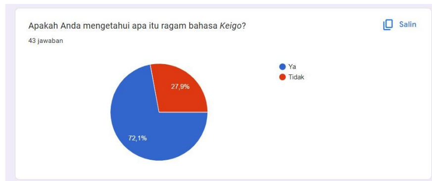
Gambar 1 Apakah anda mengetahui keigo

Peneliti melakukan survey kepada mahasiswa prodi PBJ UMY angkatan 2020 dan 2021 tentang pemahaman mereka terhadap ragam keigo . Pada survey yang peneliti lakukan, dari 43 responden terdapat 27,9% atau 12 orang mahasiswa yang tidak mengetahui tentang ragam keigo .