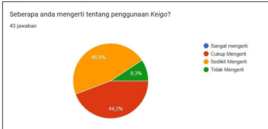
Gambar 2 Survey tingkat pemahaman keigo

keigo , yang berarti lebih dari 50% mahasiswa masih kurang memahami tentang penggunaan keigo .