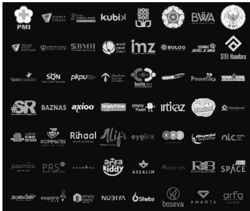
Gambar 1.1 Beberapa logo klien yang pernah ditangani oleh Syafa'at