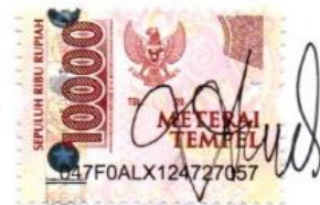
Audi Salma Sabrina