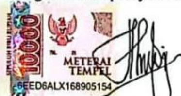
Novia Aidilla Fitri