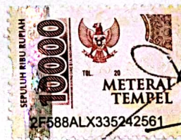
Yusril Hafid Ichsanto